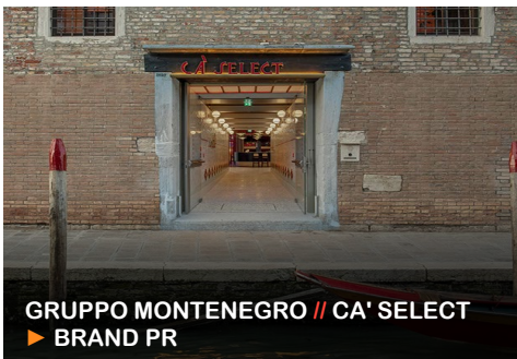
GRUPPO MONTENEGRO // CA' SELECT ▶ BRAND PR