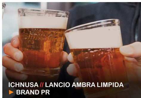
ICHNUSA // LANCIO AMBRA LIMPIDA ▶ BRAND PR