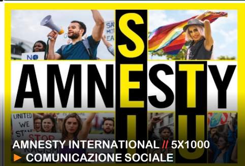
AMNESTY INTERNATIONAL // 5X1000 ▶ COMUNICAZIONE SOCIALE