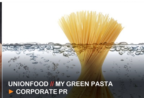
UNIONFOOD // MY GREEN PASTA ▶ CORPORATE PR