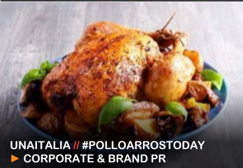
UNAITALIA // #POLLOARROSTODAY ▶ CORPORATE & BRAND PR