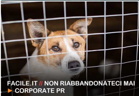
FACILE.IT // NON RIABBANDONATECI MAI ▶ CORPORATE PR