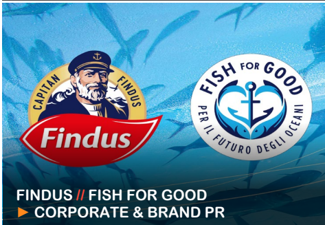
FINDUS // FISH FOR GOOD ▶ CORPORATE & BRAND PR