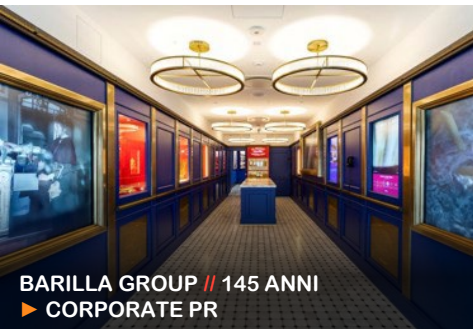
BARILLA GROUP // 145 ANNI ▶ CORPORATE PR