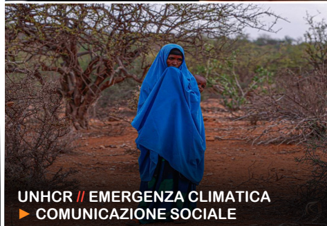
UNHCR // EMERGENZA CLIMATICA ▶ COMUNICAZIONE SOCIALE