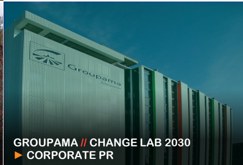
GROUPAMA // CHANGE LAB 2030 ▶ CORPORATE PR