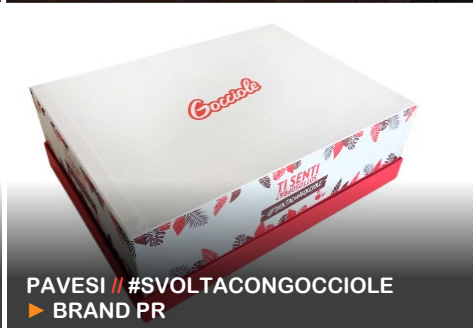
PAVESI // #SVOLTACONGOCCHIOLE ▶ BRAND PR