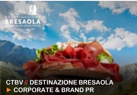
CTBV // DESTINAZIONE BRESAOLA ▶ CORPORATE & BRAND PR